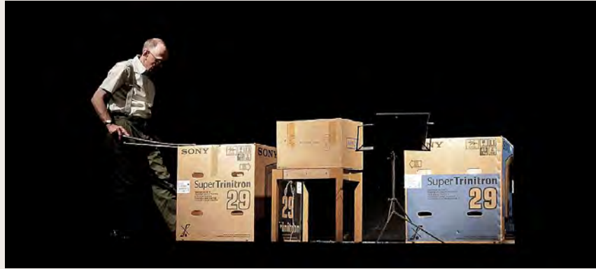
Performance, Porto 2011

WePa means Wellpappe (corrugated cardboard) and is devoted to said material.