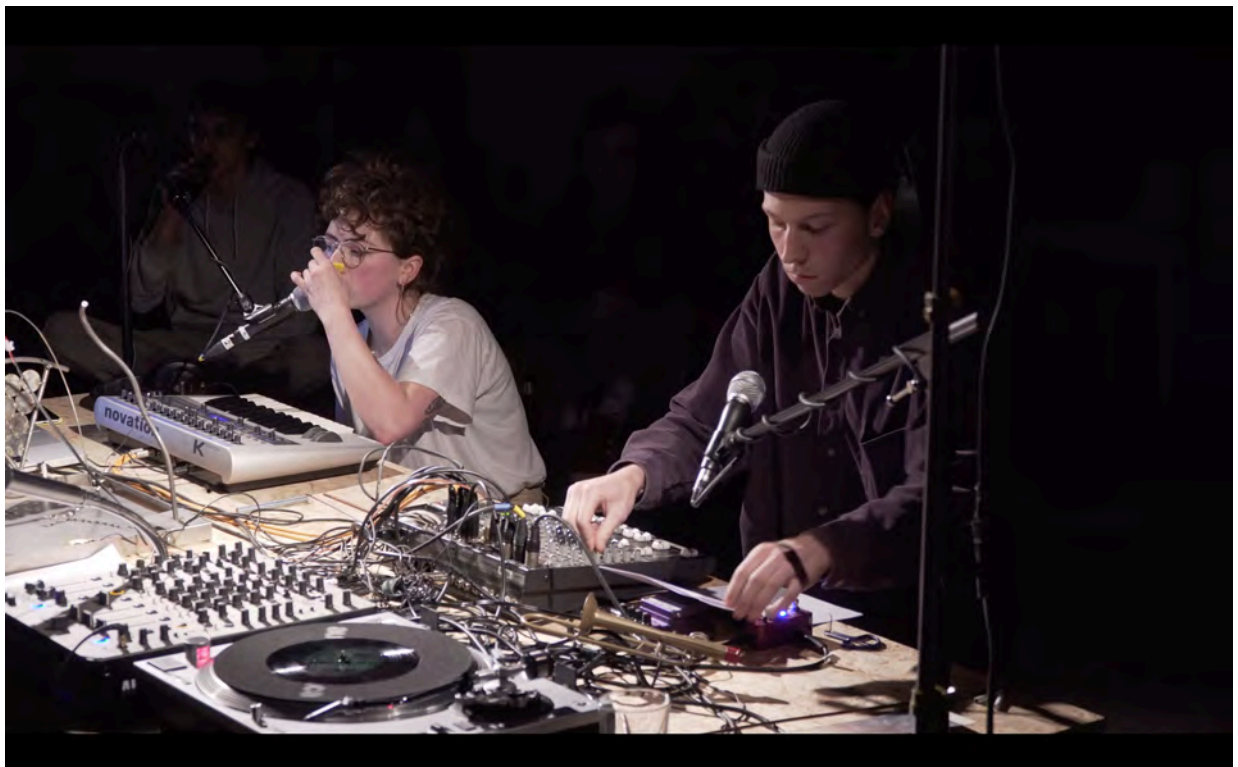
De Tapijttegels 27 feb. 2020 in DE PLAYER