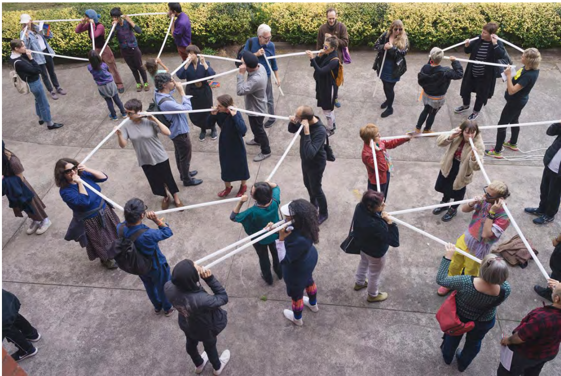
'drawing breath' Public Assembly, Liquid Architecture, Polyphonic Social.